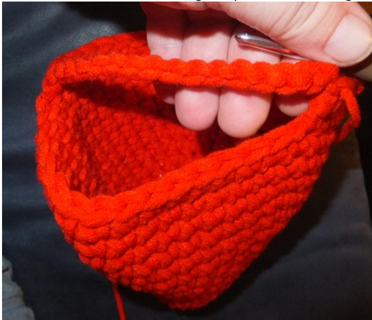
Foto ist hier mit einer anderen Wolle, als der Körper dieses Tieres soll definitiv grau werden – bitte nicht irritieren lassen