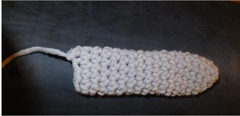
Hinterpfoten Teil 1 (grau), Teil 2 (Türkis)