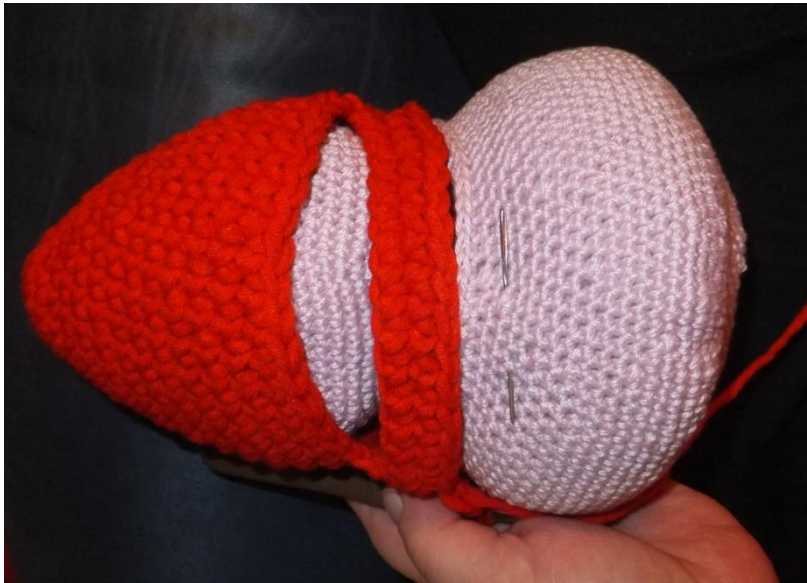
Foto ist hier mit einer anderen Wolle, als der Körper dieses Tieres soll definitiv grau werden – bitte nicht irritieren lassen