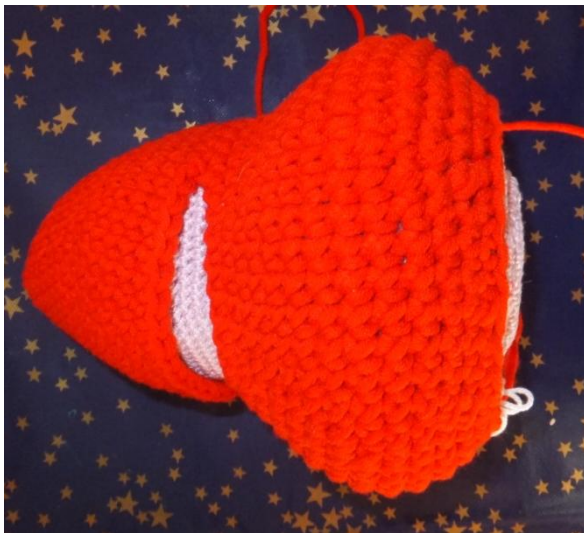
Foto ist hier mit einer anderen Wolle, als der Körper dieses Tieres soll definitiv grau werden – bitte nicht irritieren lassen