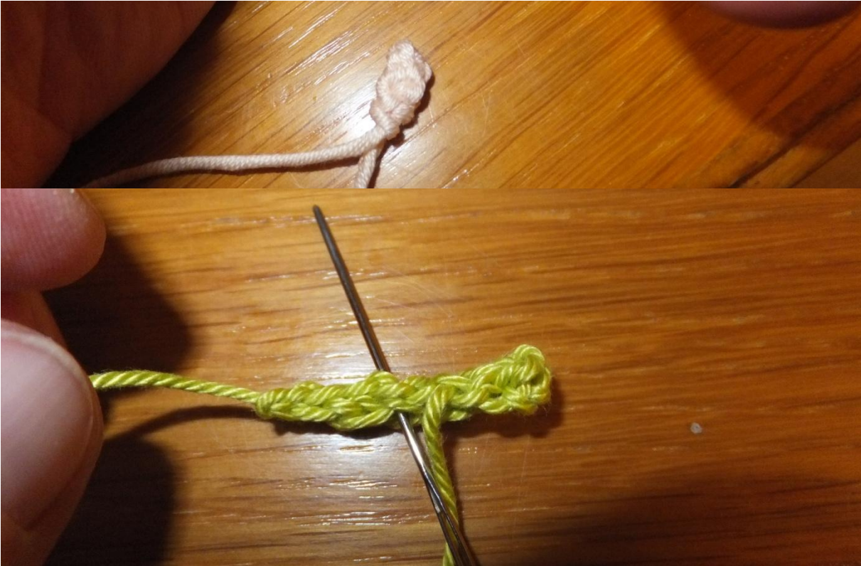
Endfaden Hände lassen, damit nähen wir die Elfe an den Stein